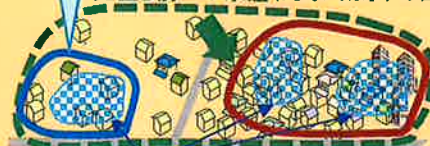
豪雨による浸水発生