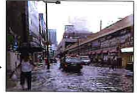
平成25年8月大阪市梅田駅周辺での浸水