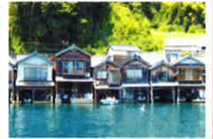
舟屋をカフェ・宿に改装して運営（伊根 油屋の舟屋「雅」）