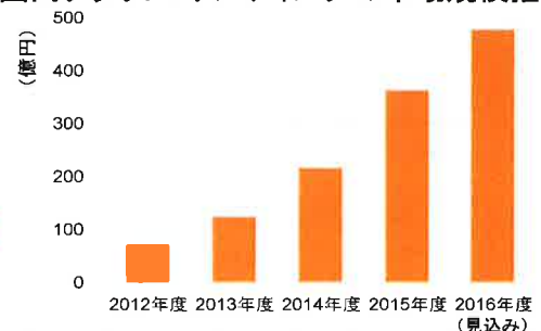
【国内クラウドファンディングの市場規模推移】