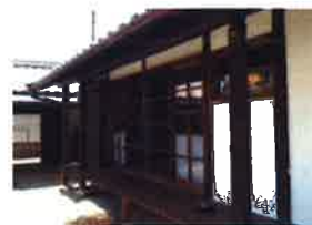
古民家を宿泊施設に改装して運営（明日香村おもてなしファンド）