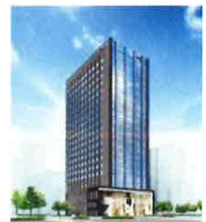
【特例事業の活用事例】 旧耐震のホテルを建て替え、 環境性能の高いホテルを開発